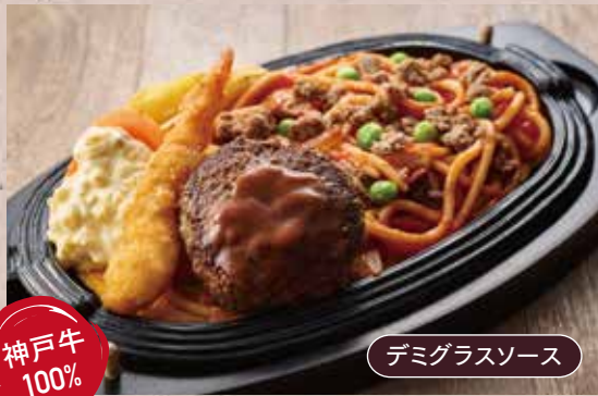
デミグラスソース