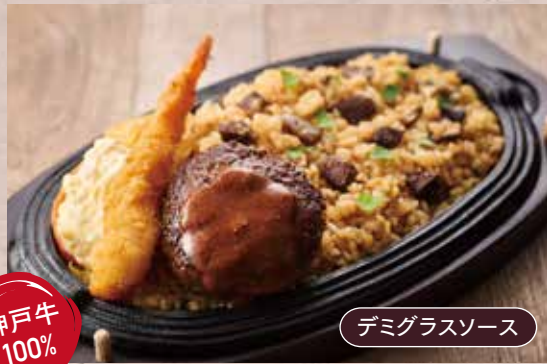
デミグラスソース