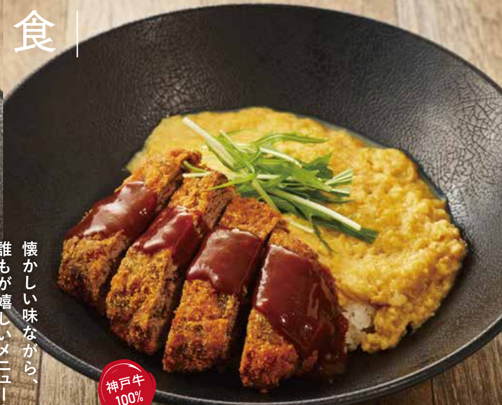
1ドリンク付き 神戸牛 デミカツ丼 ¥3,850