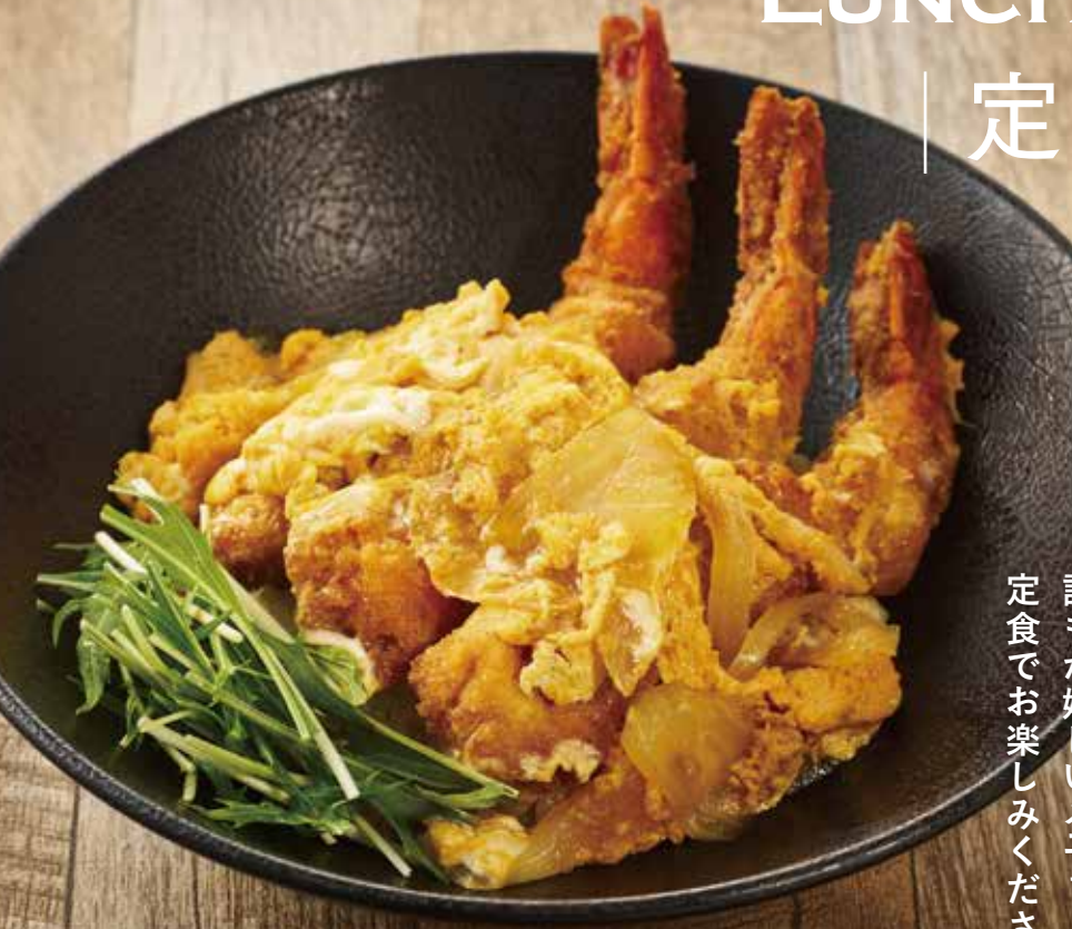
1ドリンク付き 海老カツ丼 ¥2,650