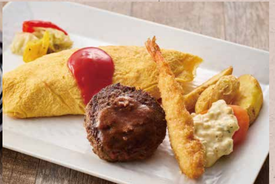
デミグラスソース