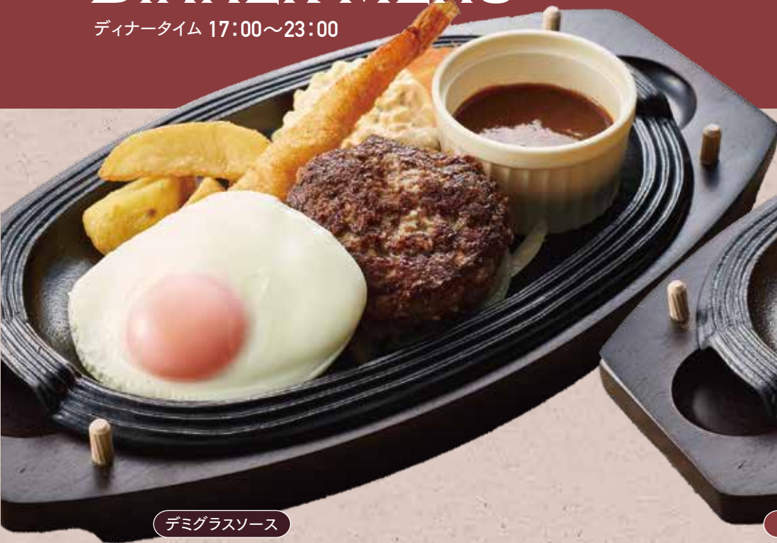
デミグラスソース