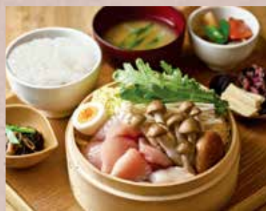
お魚のせいろ蒸し定食