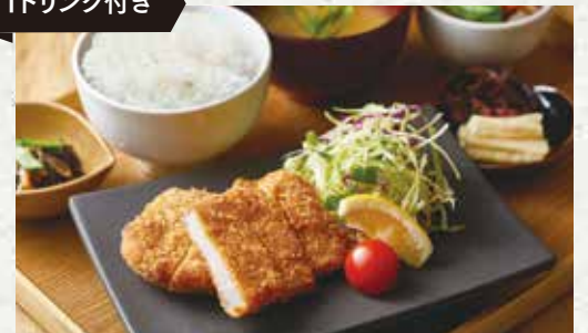
ローストンカツ定食