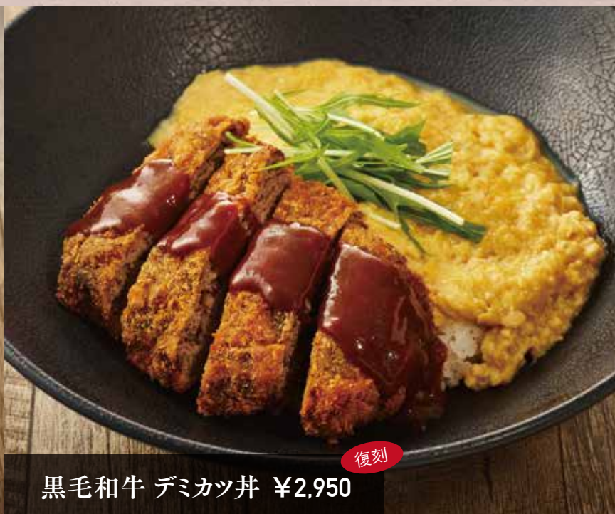
黒毛和牛 デミカツ丼 ¥2,950