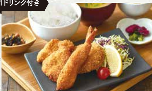
ミックスフライ定食