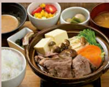
黒毛和牛しゃぶしゃぶ定食