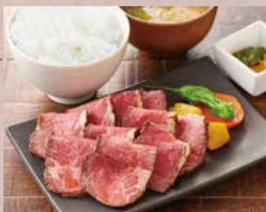
自家製ローストビーフ定食