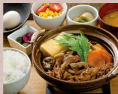
黒毛和牛 すき焼き鍋定食