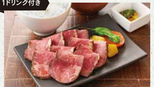
自家製ローストビーフ定食