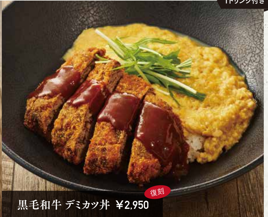
黒毛和牛 デミカツ丼 ¥2,950