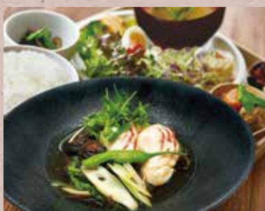
お魚と野菜の煮付け定食

※鮮魚はスタッフにお尋ねください。 (定食) ¥2,950 (単品) ¥2,500