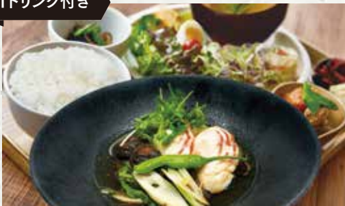
お魚と野菜の煮付け定食