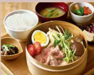
黒毛和牛せいろ蒸し定食