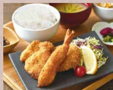
ミックスフライ定食

兵庫県産 豚ロース肉150g使用 (定食) ¥2,450 (単品) ¥2,000