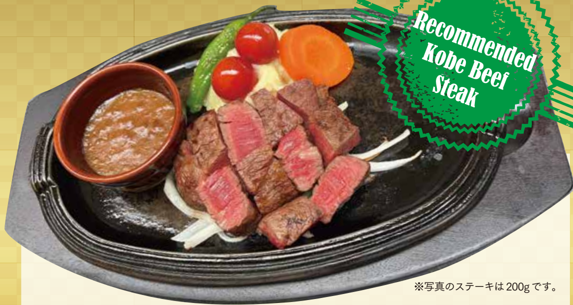
※写真のステーキは200gです。