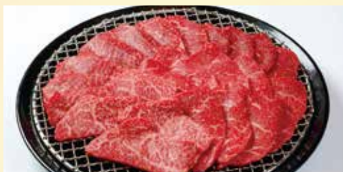
竹園特選黒毛和牛 赤身ざんまい焼肉セット