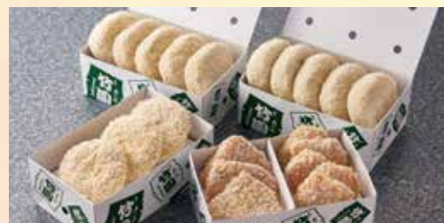
フライセット(生・冷凍便)

コロッケ 10個、ミンチカツ 3個 ヘレカツ 1人前5切れ ひとくちビーフカツ 3枚