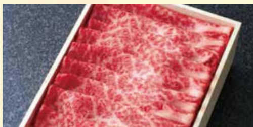
カタロース スライス