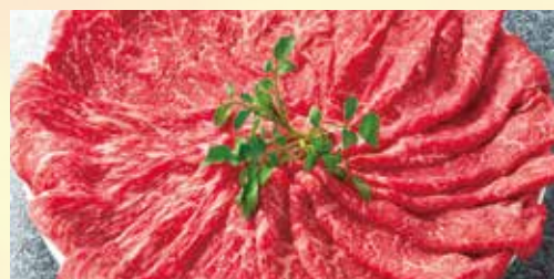
赤身スライス<マル>