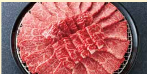
竹園特選黒毛和牛 霜降りざんまい焼肉セット