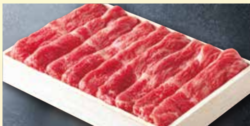
あわせスライス<モモ・バラ>

2021年 ◆販売期間：9/1<水>～10/31<日> ◆発送期間：9/2<木>発～11/5<金>着