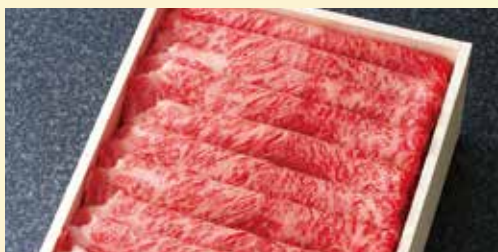
竹園特選黒毛和牛 リブローズ スライス