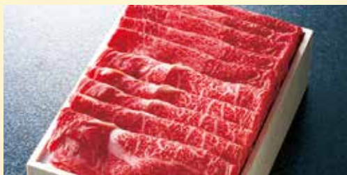
あわせスライス<ウデ・バラ>