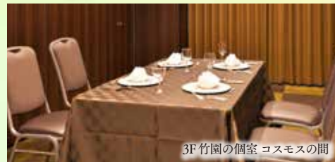
3F 竹園の個室 コスモスの間