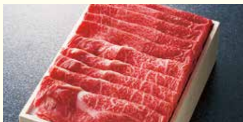
あわせスライス<ウデ・バラ>