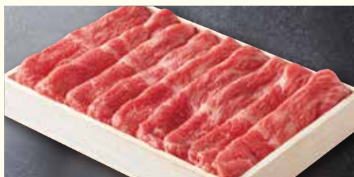
あわせスライス<モモ・バラ>

2021年 ◆販売期間：3/1<月>～5/31<月> ◆発送期間：3/2<火>発～6/5<土>着