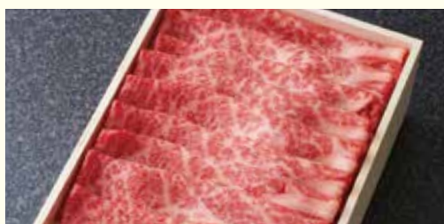
カタローズ スライス