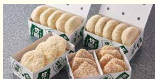
フライセット(生・冷凍便)

コロッケ 10個、ミンチカツ 3枚 ヘレカツ 1人前5切れ ひとくちビーフカツ 3枚