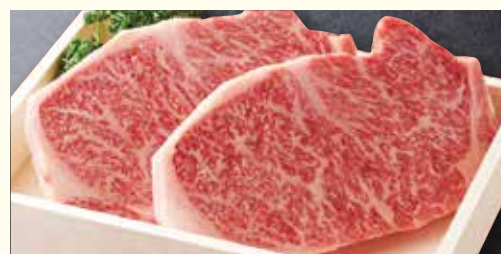
竹園特選黒毛和牛 サーロインステーキ