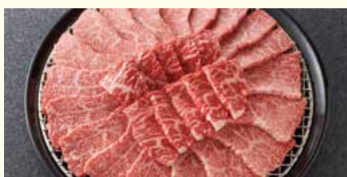
竹園特選黒毛和牛 霜降りざんまい焼肉セット