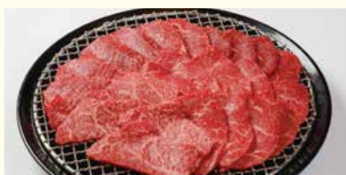
竹園特選黒毛和牛 赤身ざんまい焼肉セット