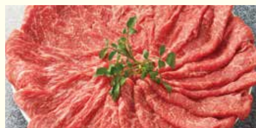
赤身スライス<マル>