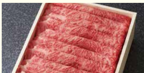
竹園特選黒毛和牛 リブローズ スライス