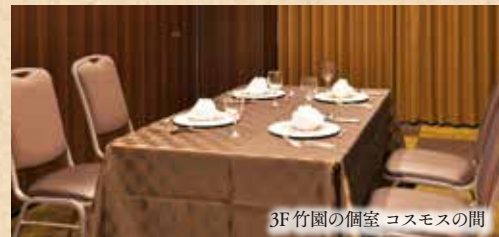
3F竹園の個室 コスモスの間