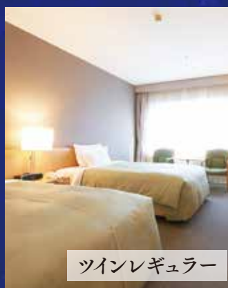
ツインレギュラー