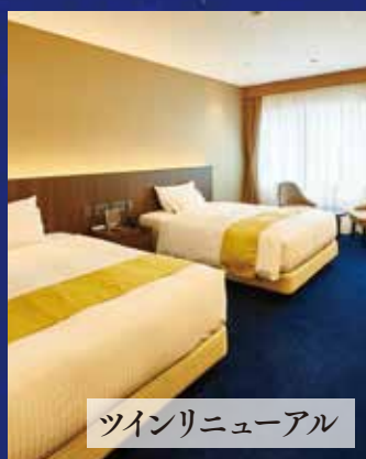
ツインリニューアル