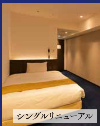
シングルリニューアル