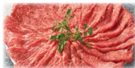
赤身スライス<マル・ウチヒラ>