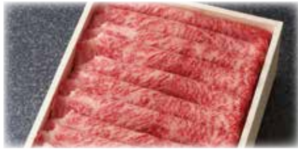
竹園特選黒毛和牛 リブローズ スライス