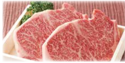
竹園特選黒毛和牛 サーロインステーキ