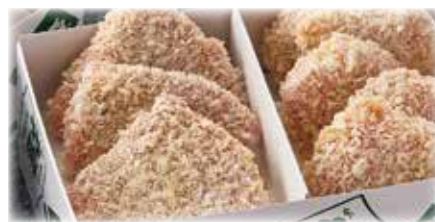
ビーフカツセット(生・冷凍便)