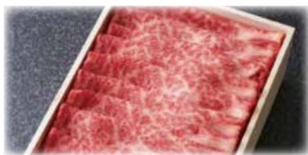
カタロス スライス