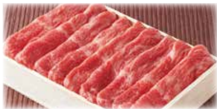
あわせスライス<モモ・バラ>