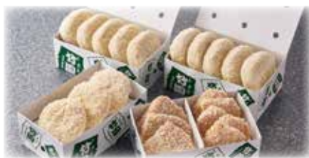
フライセット(生・冷凍便)

コロッケ 10個、ミンチカツ 3枚 へレカツ 1人前5切れ ひとくちビーフカツ 3枚