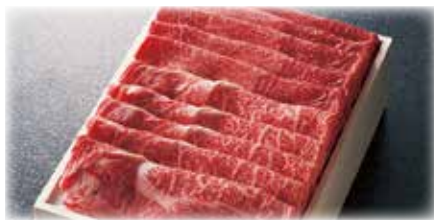
あわせスライス<ウデ・バラ>