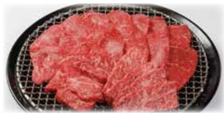
竹園特選黒毛和牛 おすすめ焼肉セット