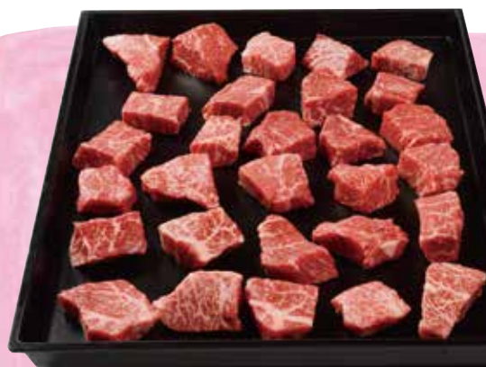
切り落としステーキ