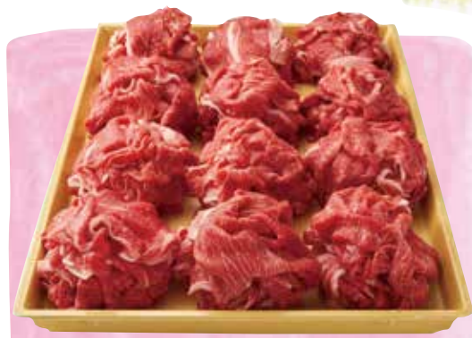
但馬牛 上切り落とし