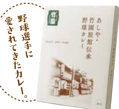
あしや・竹園旅館伝承 野球カレー