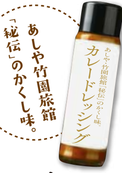
カレー ドレッシング