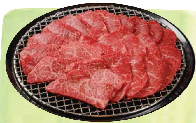
切り落とし焼肉セット